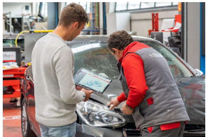
Ambos peritos llevan a cabo su valoración de daños