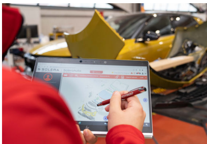
Peritación del vehículo

Los casos en los que se utiliza siempre son cuando no se alcanza un acuerdo en el importe de peritación entre el asegurador y el asegurado. Y, sobre todo, lo vamos a aplicar cuando existan discrepancias en la valoración de daños , en la peritación, es decir, que no se esté de acuerdo con las posiciones marcadas por el perito de la compañía en cuanto a sustituciones, tipo de recambio, mano de obra de reparación, desmontaje y montaje de accesorios y equipos, posiciones de pintura o costes de materiales.